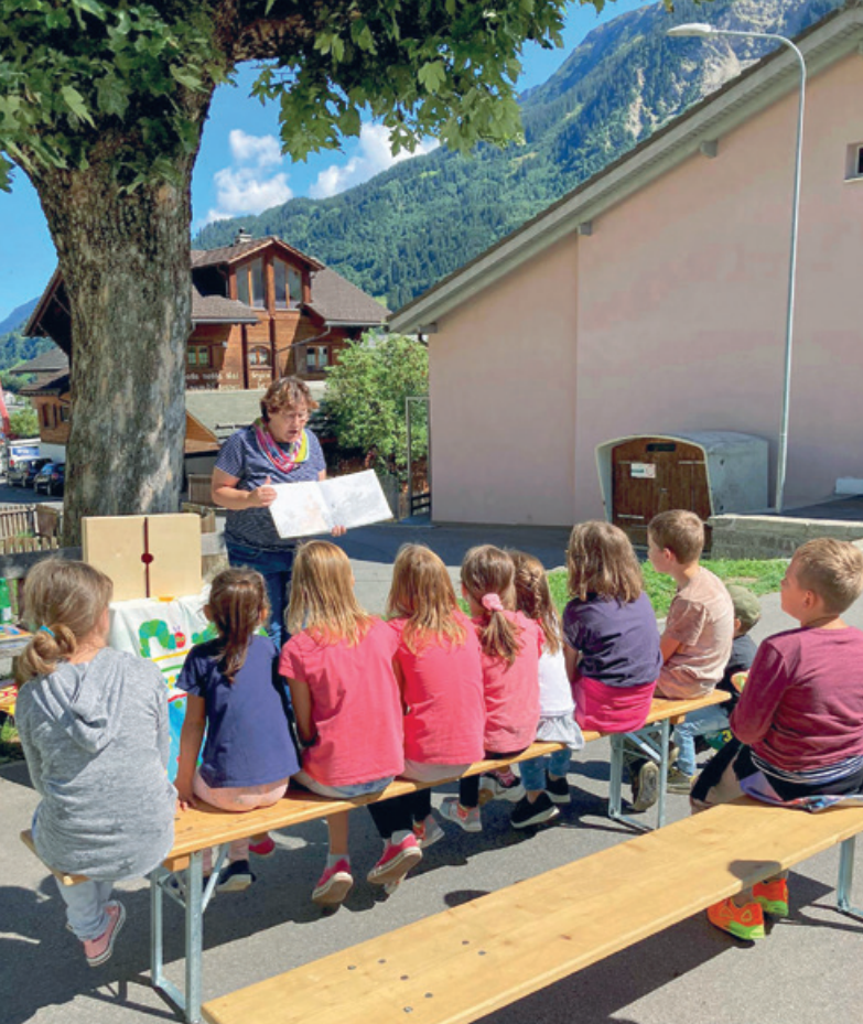
Ura da praulas durant il di dallas portas aviartas il settember 2021.

pensums da scola. Duront igl entir temps da scola stat la biblioteca a disposiziun allas scolastas, ils scolasts e las classas per empristar ora litteratura.