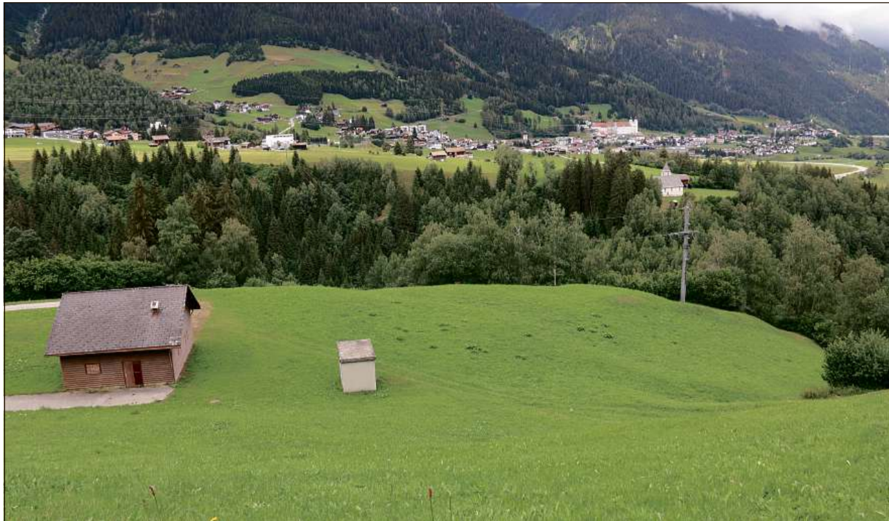
Ragischs sut Mumpé Medel duei vegnir colligiau cun ina punt pendenta sul Rein anteriur cul contuorn dalla baselgia da S. Gada.

«Culs cuosts da construziun dalla punt pendenta lessen nus buc engravegiar la vischnaunca. Per quei motiv essan nus dalla gruppa d'interess alla tscherca dils