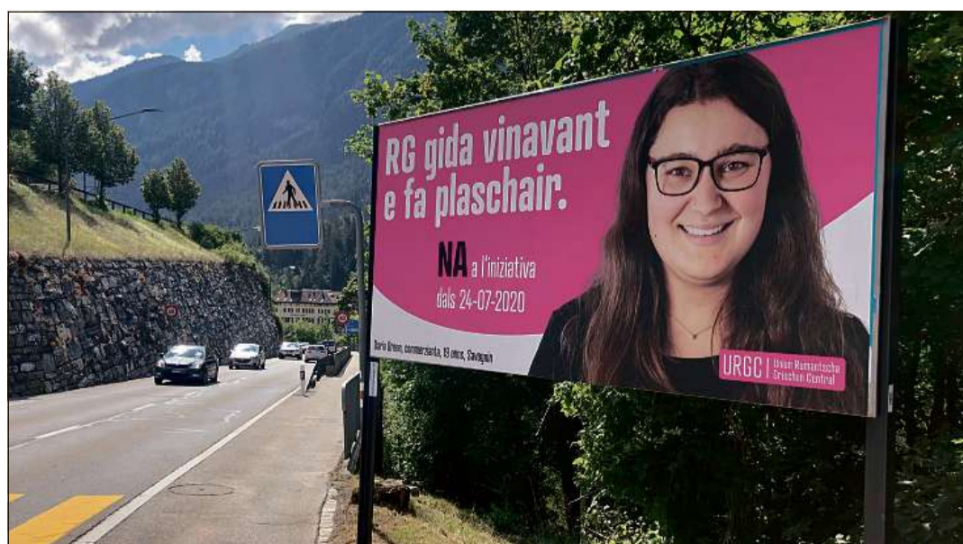
In placat a Casti en vista a la votaziun da venderdi partegnent l'iniziativa per turnar tar l'idiom.