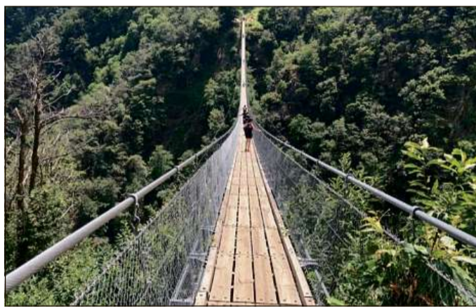
La punt pendentia da Sontga Gada a Mumpé Medel vegn construida semglientamein sco quella cheu a Carasso el cantun Tessin.